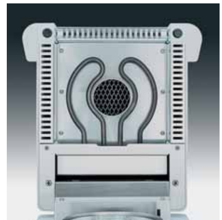
Radiatore tubolare in metallo con riflettore integrato per la distribuzione uniforme del calore

L'MA35 costituisce il nuovo modello di base nella serie di analizzatori d'umidità della Sartorius. Le prestazioni offerte e l'unità di comando sono concepite sulla base di operazioni di routine con campioni di tipo sempre uguale, così come spesso avviene nei controlli di produzione e di ingresso merci. Il fatto di rinunciare a opzioni di programma utilizzate raramente nell'ambito sopra descritto, rende l'MA35 estremamente facile da utilizzare, senza tuttavia limitarne in alcun modo la flessibilità o la precisione d'analisi.