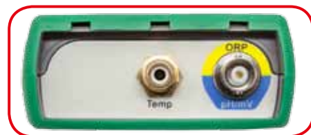
Connettori di collegamento sonde