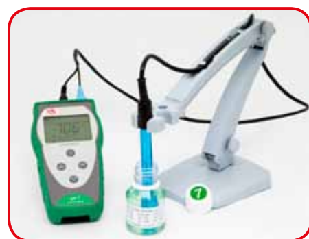
Supporto per utilizzo su banco (opzionale)