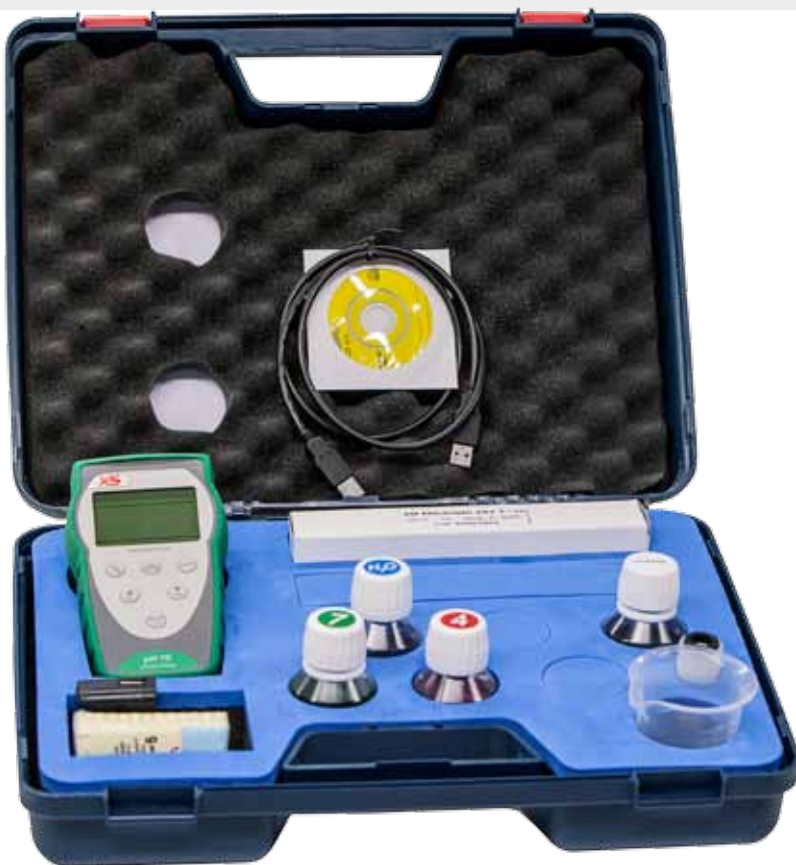
Valigia di trasporto completa di accessori, utile per essere usata come laboratorio portatile