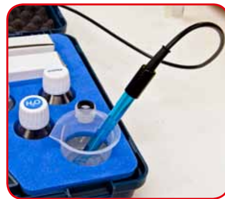
Campione in misura alloggiato nella valigia per evitare accidentali ribaltamenti