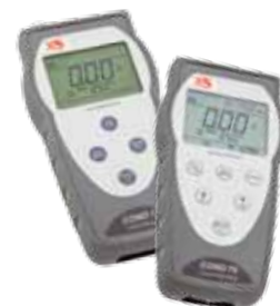
Serie Conducibilità COND 7 - COND 70