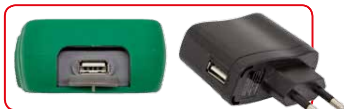
Uscita USB per scarico dati ed alimentazione tramite PC o alimentatore a rete fornito di serie