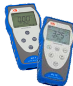
Serie Multiparametro PC 7 - PC 70