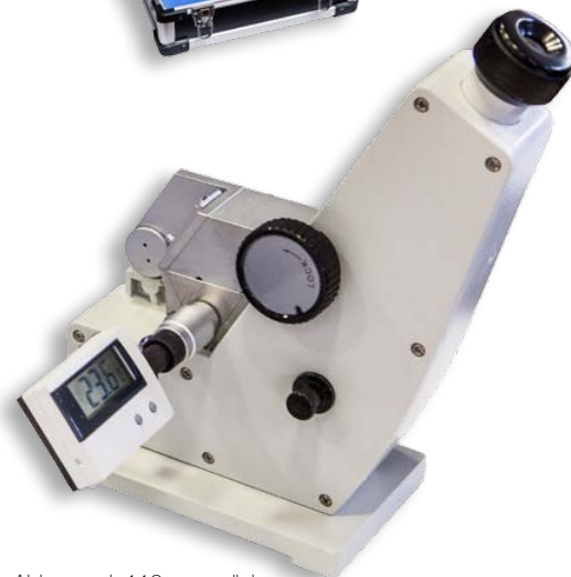
Abbe mod. 110 con valigia di trasporto