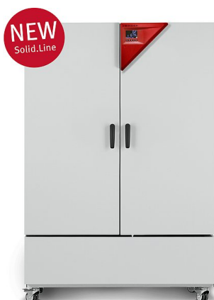
Modello KBF-S 720