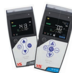
Conduktimetri e Multiparametri