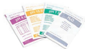
Soluzioni tampone in bustine