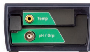
Pannello connettori pH Vio