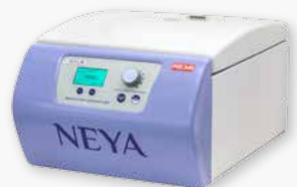
Centrifuga ventilata NEYA 10