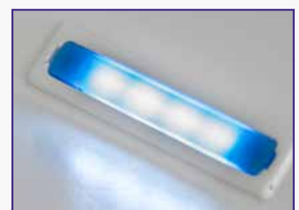
Segnalazione luminosa di fine centrifugazione