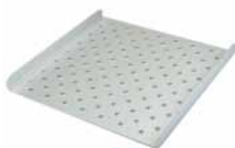
Supporto forato per fissaggio clips Codice 22006243