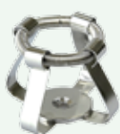
Clips per beute 25 ml Codice 22006453