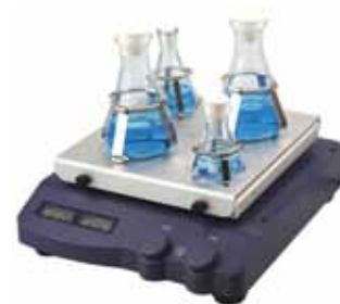
Con supporto forato e clips per beute