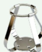
Clips per beute 500 ml Codice 22006493