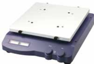
Agitatore senza supporti