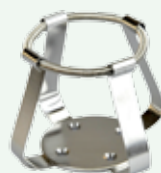
Clips per beute 200/250 ml Codice 22006483