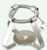
Clips per beute 100 ml Codice 22006473