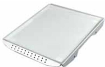
Supporto con pellicola antiscivolo Codice 22006223