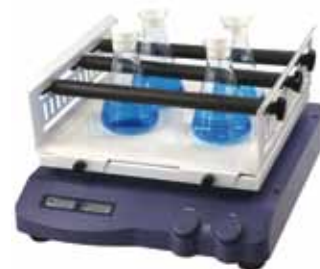
Con supporto universale a rulli regolabili