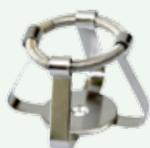
Clips per beute 50 ml Codice 22006463