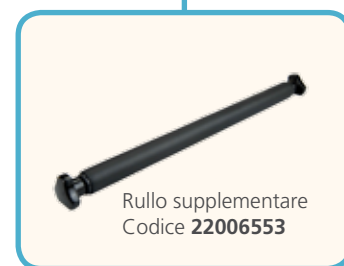
Rullo supplementare Codice 22006553