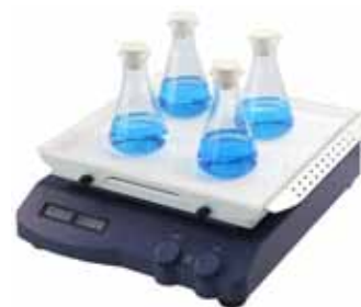
Con supporto in gomma antiscivolo