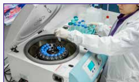
Altezza ideale alle operazioni di carico e scarico dei campioni