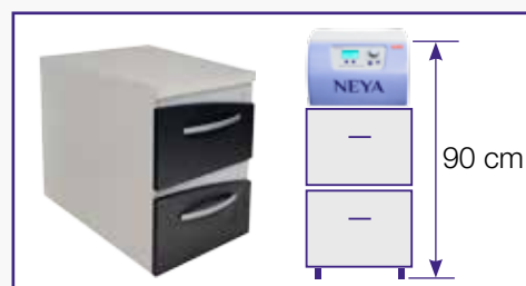
Mobile con ruote piroettanti. Codice 40101802