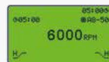
Ciclo di centrifugazione