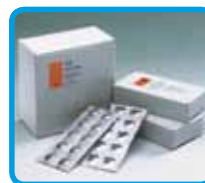
Compresse predosate in blister in alluminio