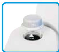
Vials con tappo a tenuta di luce