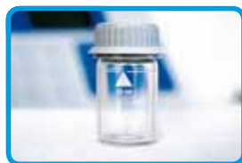
Vials per l'analisi del campione