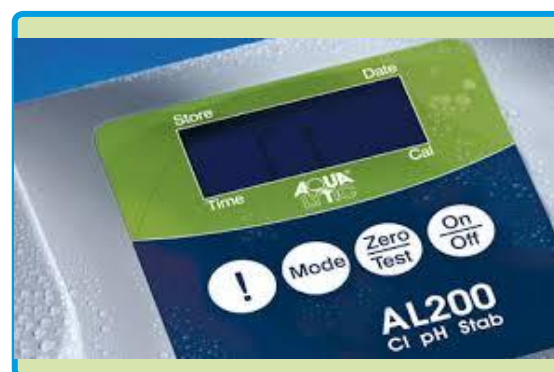
Particolare della tastiera a tenuta stagna