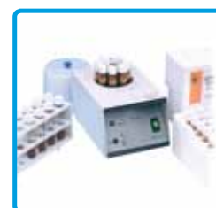
Termoreattore per analisi COD