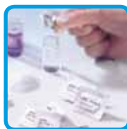
Reattivi in polvere Vario