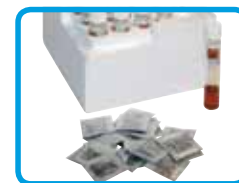
Bustine di reattivi Vario e provette per COD