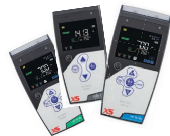
Conduttimetri e Multiparametri