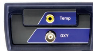
Pannello connettori OXY 7 Vio

Il modello XS OXY 70 Vio invece utilizza un sensore ottico , disponibile in due versioni: cavo di lunghezza 2 m o 10 m .