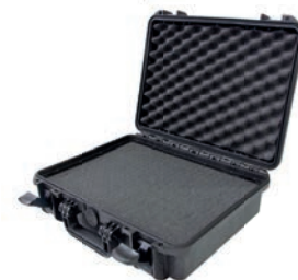
Valigia IP 67 optional cod. 50010972