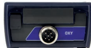
Pannello connettori OXY 70 Vio