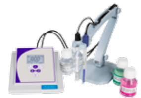
PC 62 DHS