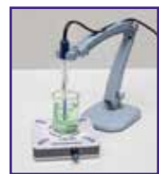
Agitatore ST 10