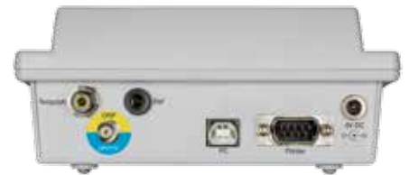
Pannello posteriore pH 60 DHS