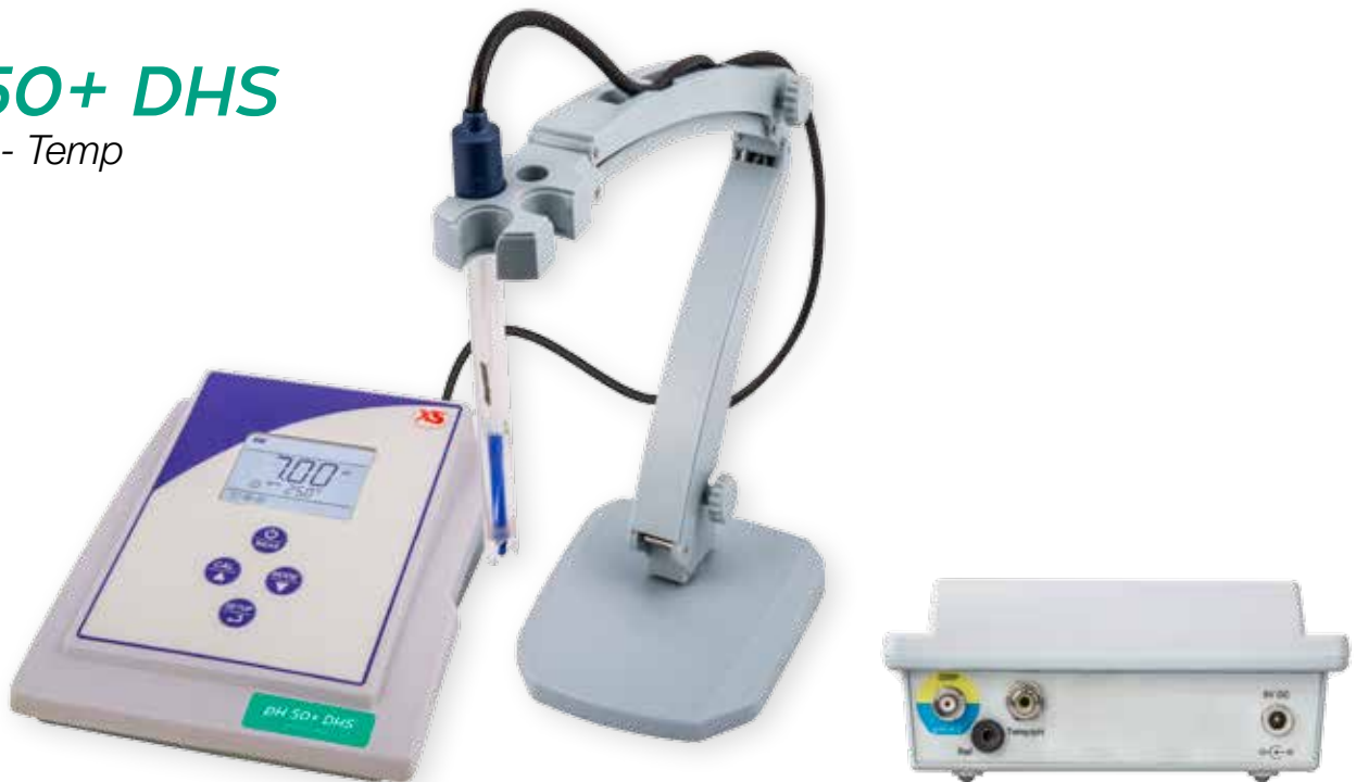
Pannello posteriore pH 50+ DHS

Un elegante ed ergonomico contenitore racchiude il meglio dell'elettronica