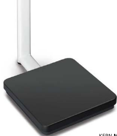
KERN MPB-P con stativo