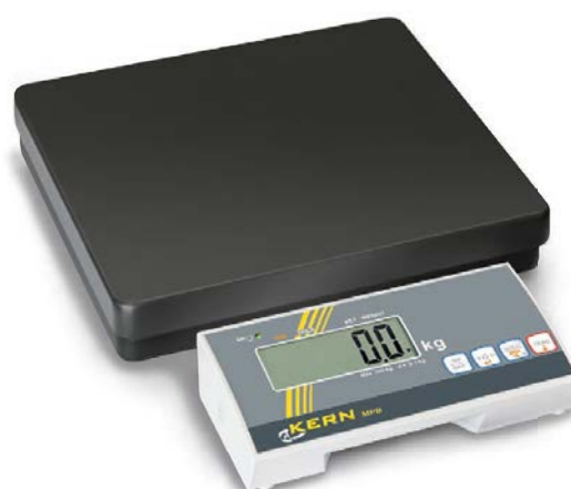
KERN MPB con apparecchio indicatore separato