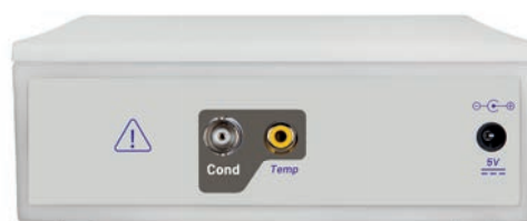
Pannello posteriore COND 50 VioLab

Il segnalatore LED permette di tenere sempre sotto controllo lo stato dello strumento.