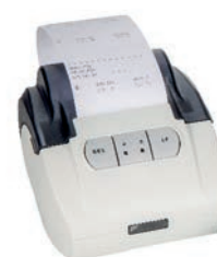
Stampante RS 232