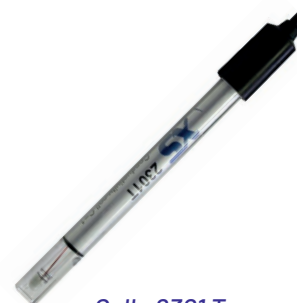
Cella 2301 T