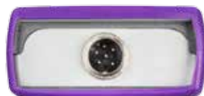
Connettore di collegamento sensore ottico (OXY 70)