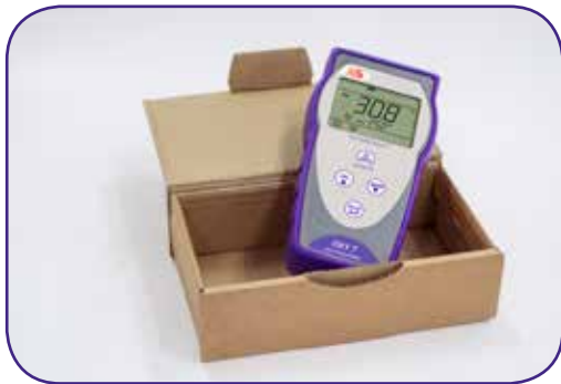
OXY 7 ECO in versione solo strumento, senza sonda Fornito in scatola di cartone ECOpack