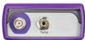
Connettori di collegamento sensore polarografico (OXY 7)