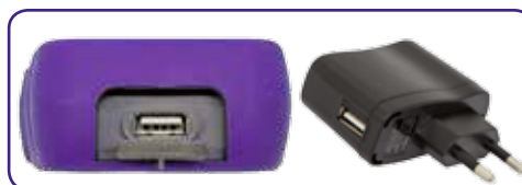
Uscita USB per scarico dati ed alimentazione tramite PC o alimentatore a rete fornito di serie (OXY70)