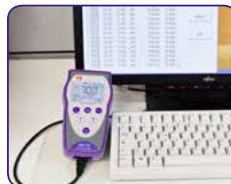
Collegamento a PC con cavo USB