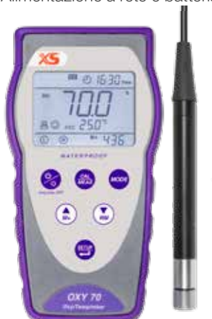
Sensore ottico LDO70/2MT

Sensore ottico O 2 -Temperatura-Pressione GLP - Data Logger USB Alimentazione a rete e batteria