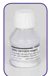
Standard 0 ossigeno monouso