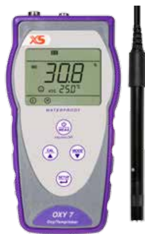
Sensore polarografico DO7/3MT

Sensore polarografico O 2 -Temperatura-Pressione